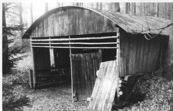
Bild von der Garage gegenüber