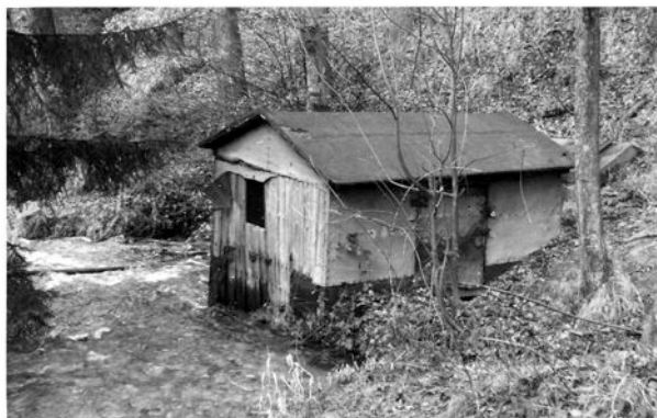
Bild von der damaligen Wasserversorgung