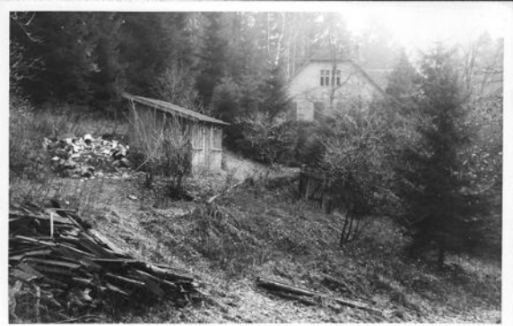
Bild von der Zufahrt die es noch nicht gibt